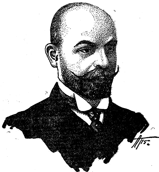
ש. ש. פרוג.